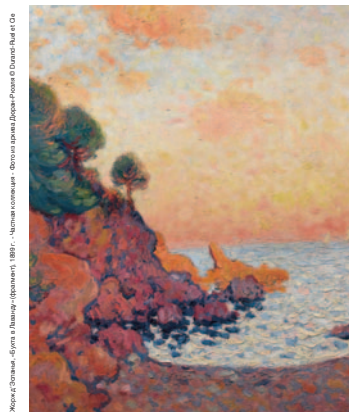
Поль Дюран-Рюэль и постимпрессионизм