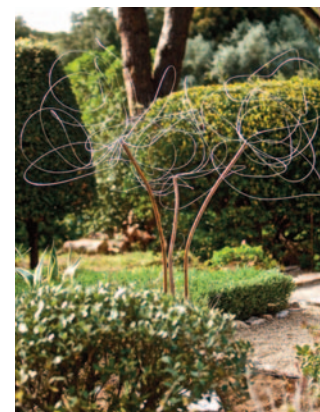
Мари-Нозель де ла Пуа Фотосинтез